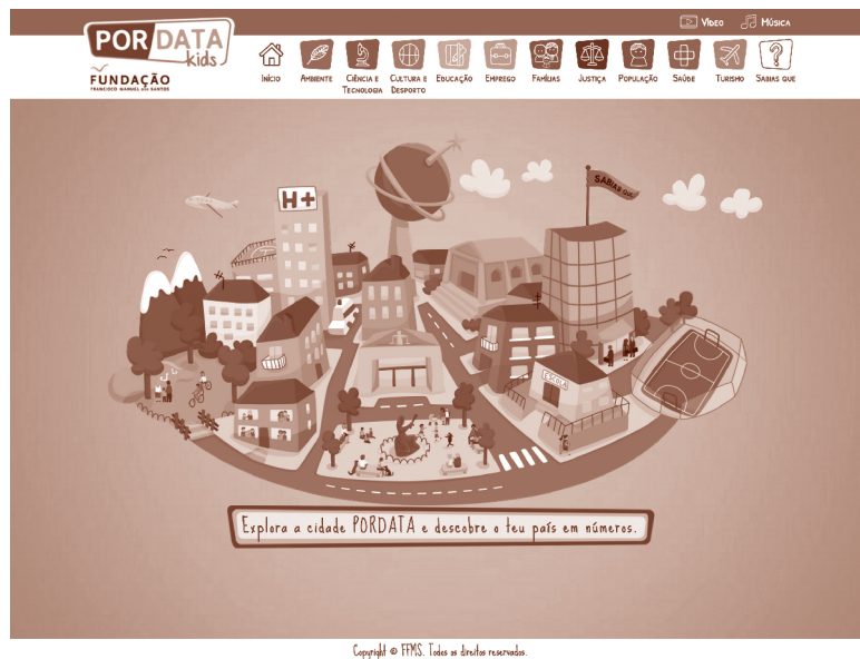
Figura 1.—Imagem de entrada do site PORDATA Kids.

Há mais homens ou mulheres a praticar desporto em Portugal? Um palpite? Serão mais homens. Mas qual a diferença entre o número de homens e de mulheres que praticam desporto? E como evoluiu? Em 2014 estavam inscritos em desportos federados 404623 homens e 141725 mulheres. Mais 262898 homens, cerca de 3 vezes mais, conclui-se. E quantos clubes desportivos existem em Portugal? São 26. Destes quantos têm futebol? E atletismo? Quantas medalhas Portugal ganhou no desporto? E quantas em provas (para)olímpicas? Quantos são os praticantes de desporto até ao escalão júnior? E júnior? E sénior? Sabe quantas amostras de doping são recolhidas durante as provas? E fora delas? Quantas pessoas em Portugal praticam ténis? E futebol? E natação? Consegue estimar quantas pessoas estão a preparar-se para serem treinadores? E para serem árbitros e juízes? Se gostaria, não só de saber as respostas a estas perguntas, mas também de saber como evoluíram os números nos últimos anos pode ir agora à cidade PORDATA Kids ( www.pordatakids.pt , figura 1), portal do projeto com o mesmo nome, lançado pelo projeto PORDATA [1] . Com o lema «Explora a cidade PORDATA e descobre o teu país em números» este site destina-se a jovens entre os 8 e 12 anos. Num pequeno vídeo introdutório, somos conduzidos pela cidade por Rita, uma menina que se mudou para Portugal, tem um meio-irmão e quer