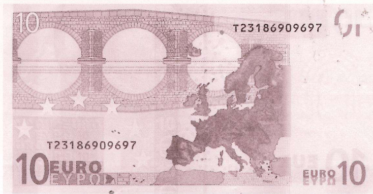
Figura 2. Nota de 10 euros.

meros tivessem algarismos de controlo diferentes, mas tal não acontece pois ambos têm como algarismo de controlo o zero. Esta situação surge do facto de se ter substituído o controlo dez pelo zero. De facto, mostra-se que, se tivesse sido escolhido uma letra ou um símbolo para substituir o dez como algarismo de controlo, este erro seria facilmente detectado bem como todos os outros erros singulares. Mostra-se igualmente que, se este sistema tivesse sido correctamente concebido, também todas as transposições consecutivas (troca de dois algarismos consecutivos) seriam detectadas. Como estes dois tipos de erro são os mais frequentes, teríamos um bom sistema de controlo.